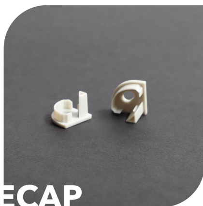
Bouchon de finition PRF16-16ECAP