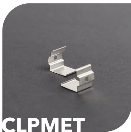
Clip métallique PRF16-16CLPMET