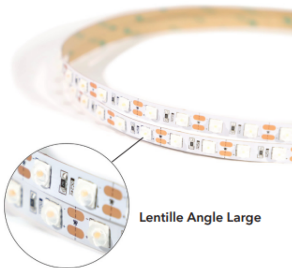
Lentille Angle Large